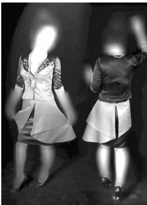
شکل ۳- دوخت نهایی مدل شماره (۱)