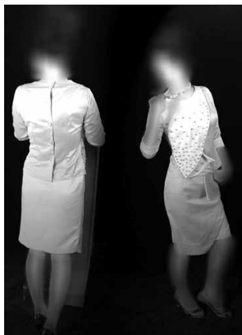
شکل ۴- اتود رنگی و دوخت نهایی مدل شماره (۲)

از میان پارچه‌های مناسب برای این کت و دامن از دو رنگ ساتن به رنگ کرم و زرد سبز استفاده شده است. رنگ زرد شادی و نور خورشید است این رنگ شاد و پر انرژی است. و رنگ سبز مایل به آن آرامش را تشدید می کند، رنگ کرم باعث هم خوانی میان این رنگها شده است.