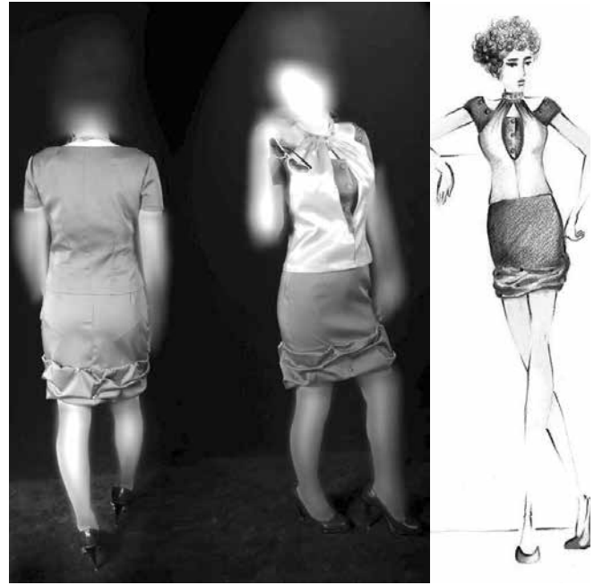
شکل ۶- اود رنگی و دوخت نهایی مدل شماره (۴)