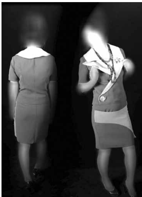
شکل ۵- اتود رنگی و دوخت نهایی مدل شماره (۳)

برای این مدل از دو رنگ پارچه آبی تیره و آبی روشن از جنس کرپ انتخاب شده است. تمام پارچه لایه حریر زده شده تا لباس پس از دوخت خوش فرم تر و شکیل تر به نظر آید. از رنگ آبی روشن در یقه و روی تزئین دامن استفاده شده که در یقه از رنگ روشن تر تاکید بیشتری روی آن شده و بیشتر به چشم می خورد و تأثیرات روانی آن پر رنگ کرده است، رنگ آبی به لباس آرامش، متانت، حفظ تعادل روحی روانی داده است، این رنگ حالات روحانی دارد و نمادی از پاکی و آسمان است.