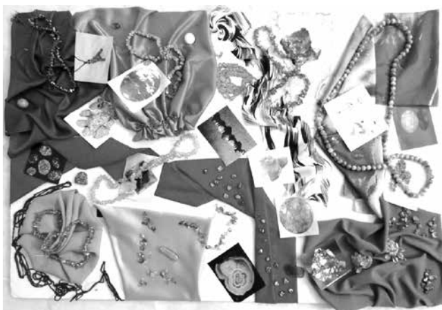
شکل ۱- استوری برد نهایی

ابتدا به مطالعه و بررسی انواع سنگ‌های طبیعی و درمانی پرداخته و آنها را از حیث